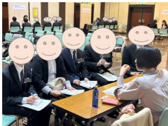
大盛況のうちに終了した昨年度の様子

たとえば、サポステで開催されているプログラムに参加し、就活に向けての自己理解を深め、自身の働く業界を絞り、具体的な職種を決めておく、、、などなど。 今から行動に移し準備できることがたくさんあります。 いま現在方向性が絞れていない方は、サポステの就労相談を活用して相談員にどんどん相談してみましょう！ サポステでは「就活に向けて何から始めたらいいのか」という相談はOKなんです！相談することによって自分の考えが整理されてヒントが見つかり、今の自分にはない発見があるかもしれません。前回参加できなかった方もぜひ8月を目指して今から準備をして行動を起こしてみませんか。 合同企業説明会をはじめ、通年さまざまなイベントを開催しています。 サポステ利用を検討中の方は、遠慮なくお問い合わせください！！